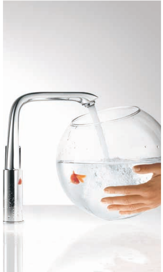
Schützen Sie Ihr Trinkwasser vor Keimen und Legionellen.

Wir erinnern Sie jährlich an den Check Ihrer Heizung und Sanitärtechnik. So können Sie sich getrost auf andere Dinge konzentrieren.